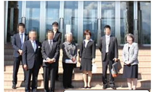
大石田中学校にて

「我が町も、とにかくたくさんの方に学校に興味を持ってもらい、学校に来てもらえるよう声をかけることが第一歩？」